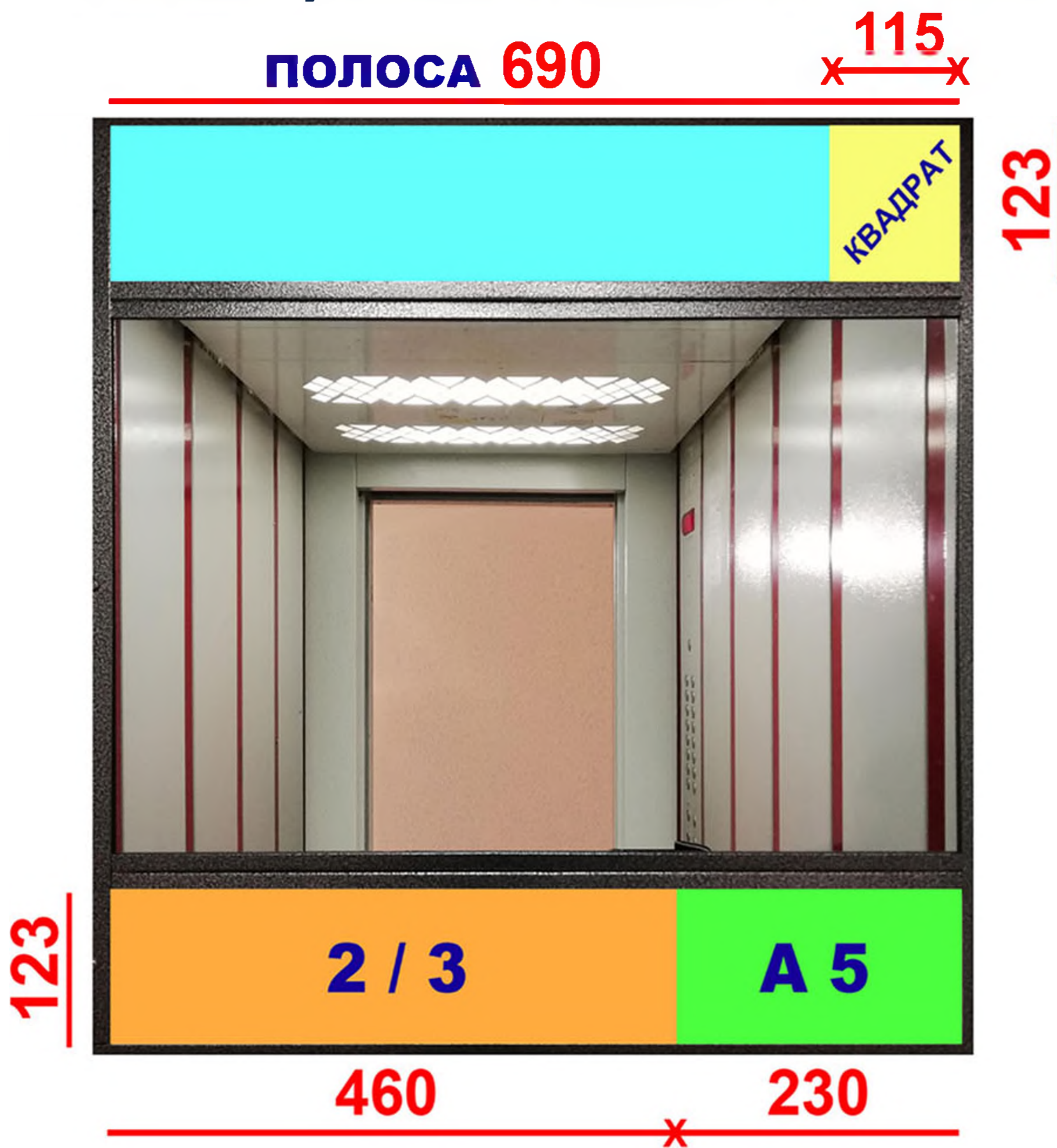
Схема расположения макетов

+7 922 781 32 22 www.медиа север.рф media-sever@mail.ru